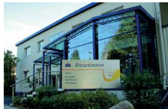
Das Heiligenhauser Unternehmen Breuckmann