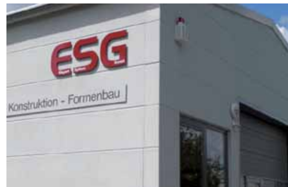
ESG Elepart an der Röttgenstraße in Velbert