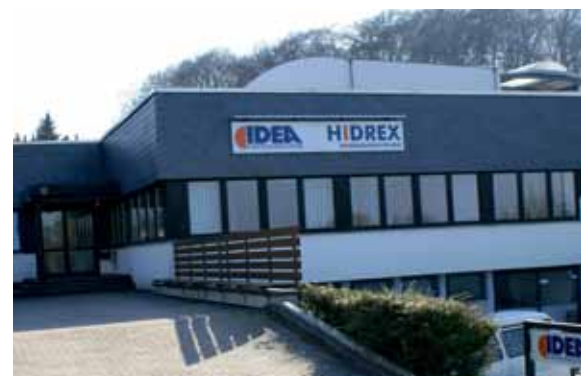
IDEA Elektronik-Systeme GmbH in Heiligenhaus